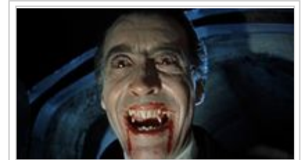
L'acteur Christopher Lee, dans le rôle de Dracula, dans le film de 1958.