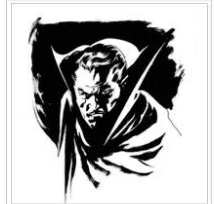
Le comte Dracula, apparu pour la première fois dans le roman Dracula de Bram Stoker, à la fin du XIX e siècle.